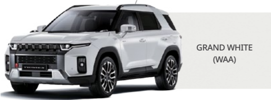
GRAND WHITE (WAA)