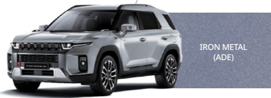
IRON METAL (ADE)