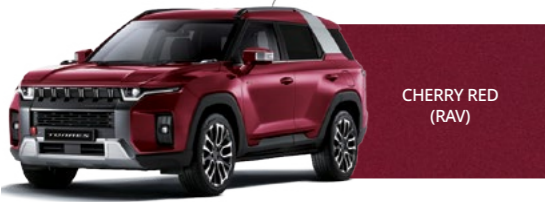
CHERRY RED (RAV)