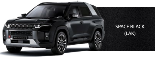
SPACE BLACK (LAK)