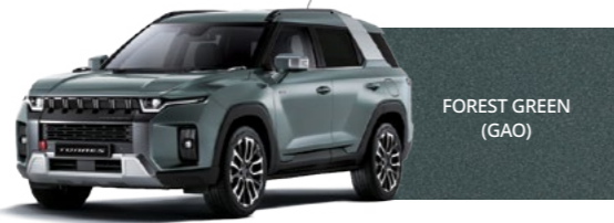
FOREST GREEN (GAO)